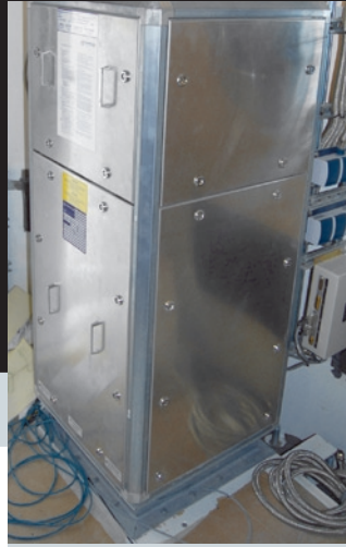
Zwei Umluftgeräte sorgen in der Empfängerkabine für eine Temperatur zwischen 16 und 22 °C.

Insgesamt fallen thermische Lasten von 8,45 kW an. Mit 6,45 kW wird der Großteil der Lasten in der Kabine durch den Empfänger (1,25 kW), der die empfangenen Daten aufzeichnet, sowie durch die Schränke