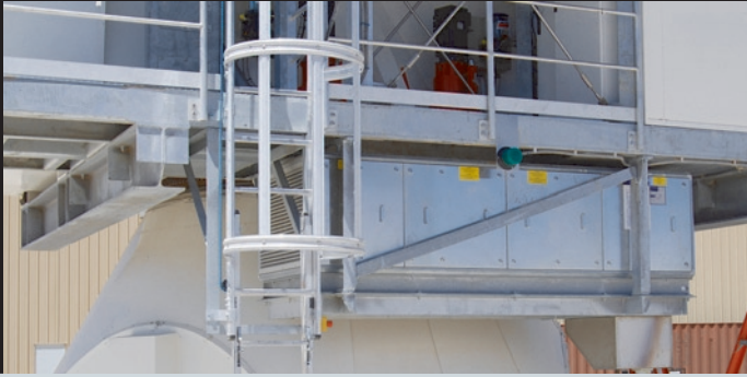
Der Kaltwassererzeuger mit freier Kühlung wurde im Schatten unterhalb der ersten Wartungsebene positioniert.

Schatten zur selben Zeit Minustemperaturen herrschen können. Angesichts der unterschiedlichen Ausdehnungskoeffizienten der Werkstoffe kann es ohne entsprechende Klimatechnik zu einem thermischen Verzug kommen, der reproduzierbare Messungen unmöglich macht. Gleichzeitig müssen die Wärmelasten im Antenneninnern abgeführt werden, um ein Überhitzen der Empfängerkabine und ihrer computergesteuerten Messinstrumente zu verhindern. Neben der starken Sonneneinstrahlung galt es, weitere Einflussfaktoren zu berücksichtigen. So ist die Luft in 5.100 m Höhe nur etwa halb so dicht wie auf Normalnull. Unter diesen Bedingungen können viele für den europäischen Markt üblichen Standardbauteile – etwa im Bereich der Ventilatoren – nicht verwendet werden, was den Einsatz spezieller Komponenten und eine spezifische Auslegung der Klimatechnik erforderlich machen. Zudem muss ein Teil der Anlagen in der Empfängerkabine angeordnet werden. Da diese bei der Ausrichtung des Teleskops frei in allen drei Dimensionen bewegt wird, mussten auch die Klimageräte in allen möglichen Positionen voll funktionsfähig bleiben.