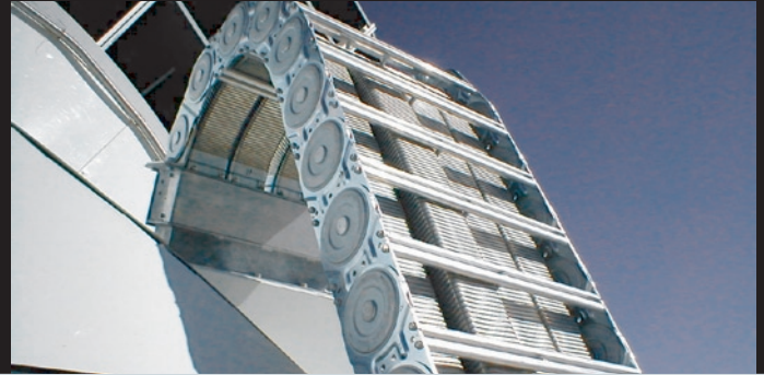
Die Glykolschläuche werden im Außenbereich von einem flexiblen, gepanzerten Rohr vor Umwelteinflüssen geschützt.

Aufzeichnungsinstrumente sowie den Empfänger