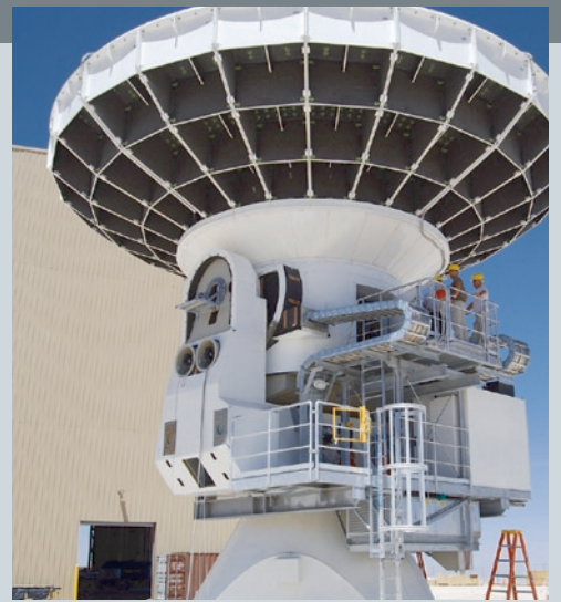
Die 100 Tonnen schweren Teleskope werden im Basislager zusammengesetzt und dann mit Riesentransportern zum 28 km entfernten Hochplateau gebracht.

Die Radioantennen empfangen Millimeter- und Submillimeterwellen im Bereich zwischen Radiowellen und Infrarotstrahlen und sollen im Verbund ein einziges großes Teleskop von mehreren Kilometern Durchmesser bilden. Zu diesem Zweck können alle Antennen gleichzeitig auf ein Objekt ausgerichtet werden. Der bewegliche Teil des Teleskops besteht aus einer staubdicht geschlossenen Einheit mit dem 12 m durchmessenden Parabolspiegel und der Empfängerkabine, in der die Auswertungs elektronik und Kommunikationstechnik untergebracht sind. Um die erforderliche Messgenauigkeit zu erreichen, müssen die Radioantennen auf 1/3.600 Winkelgrad genau positioniert werden – präzise genug, um einen Golfball aus 15 km Entfernung anzupeilen.