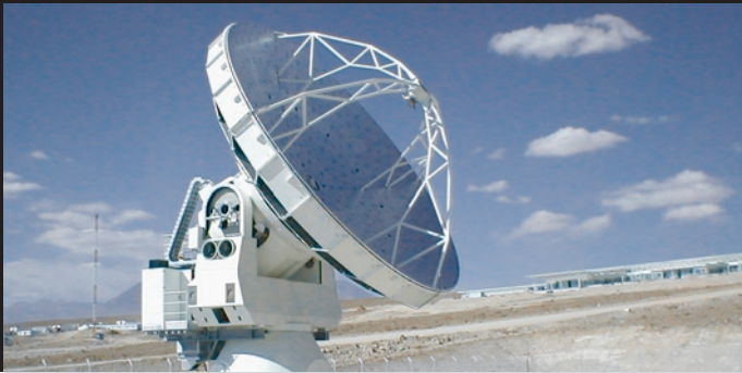
Beim Atacama Large Millimeter Array (ALMA) werden insgesamt 66 Radioantennen zu einem riesigen Teleskop zusammengeschaltet.